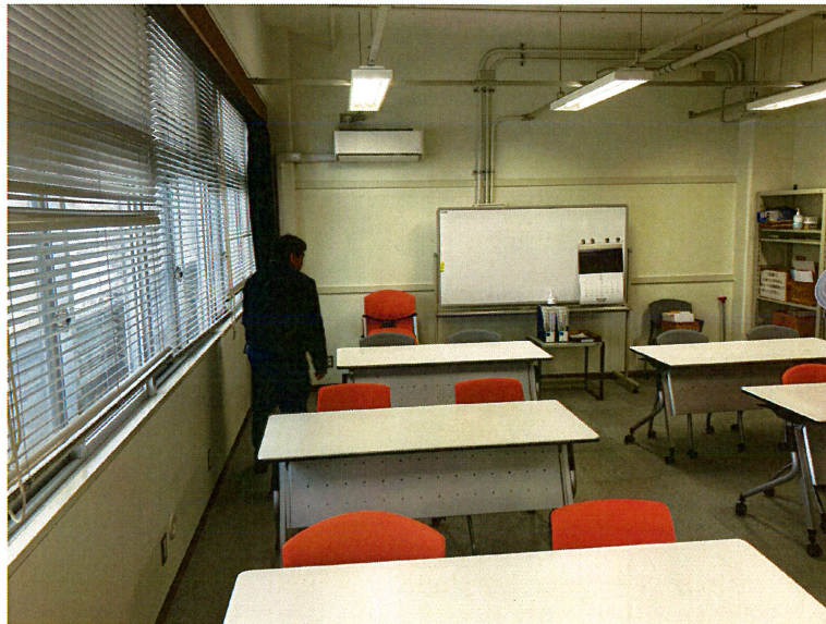
図1 職場巡視の様子

今日の岐阜大学における衛生工学衛生管理者の業務のうち、職場巡視の様子を図1に、局所排気装置定期自主検査の様子を図2に示す。