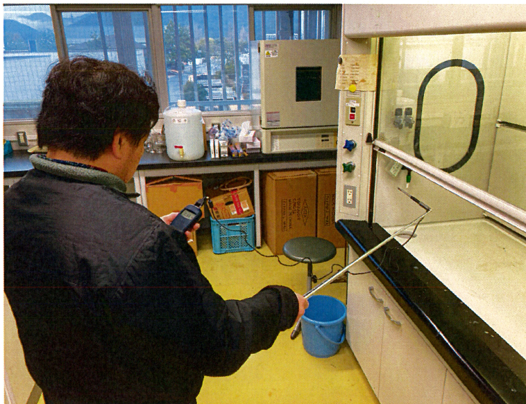
図2 局所排気装置（ドラフトチャンバー）の制御風速測定

通常の職場巡視は、施設統括部職員、保健管理センター保健師、高等研究院技術職員の3名が巡視者として行っている。巡視項目は多々あるが、主としては有事の際の避難において障害となる物品類や、転倒や落下の恐れのある物品が置かれていないか等の確認を行っている。